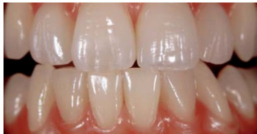
Für die Zahntechnik kann man viel aus den Erkenntnissen zur Ästhetik lernen: nicht vollkommen symmetrisch, individuell, lebhaft, zum großen Ganzen passend – wie die Blütenblätter in einer Rose.

Das Buch von Achim Ludwig „Das Geheimnis der Ästhetik. Eine Reise zum Urgefühl des Menschseins“ erscheint im Herbst im Pro Business-Verlag, Berlin, mit zahlreichen Schwarz-weiß-Abbildungen und einigen farbigen Abbildungen, gedruckt auf weißem Papier. Gebundene Ausgabe, Preis unter 30 Euro. Von der nummerierten Kunstaussgabe „Edition 100“ mit zahlreichen Farbabbildungen, gedruckt auf farbigem Papier, sind beim Autor noch einige Exemplare erhältlich.