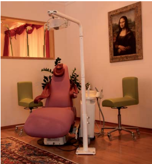
Um individuelle Zahnästhetik zu schaffen, legen die „Da Vincis“ Wert auf engen Patientenkontakt. In ihrem „Ästhetikatelier“ gibt es daher einen Patientenbereich – und die „Mona Lisa“ an der Wand.

Zugespißt führt die Frage nach Individualität auch zum Unvollkommenen und Hässlichen. Die Kunst liegt darin, noch hier Ästhetik und Schönheit zu finden. Mit der frisch gewonnenen Erkenntnis und neuem Blick lässt sich der einstmalig empfundene Gegensatz zwischen Individualität, sogar Hässlichkeit, einerseits und